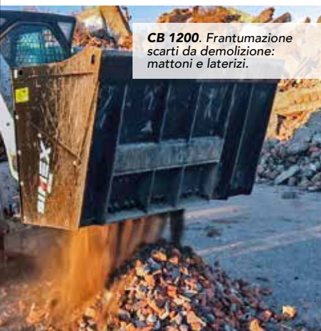
CB 1200. Frantumazione scarti da demolizione: mattoni e laterizi.

Si declina ogni responsabilità per le informazioni fornite. Con riserva di modifiche tecniche.