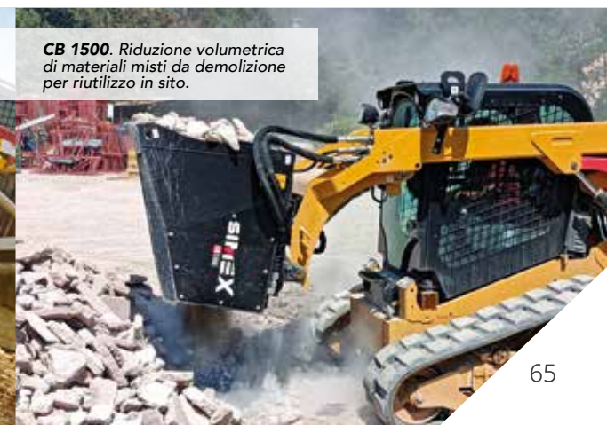
CB 1500. Riduzione volumetrica di materiali misti da demolizione per riutilizzo in sito.