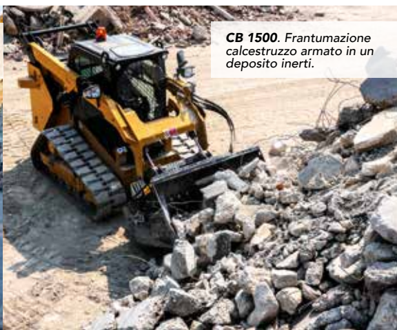
CB 1500. Frantumazione calcestruzzo armato in un deposito inerti.