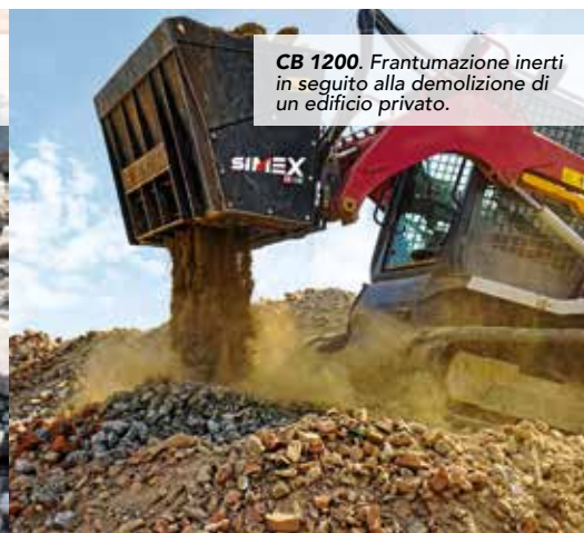
CB 1200. Frantumazione inerti in seguito alla demolizione di un edificio privato.